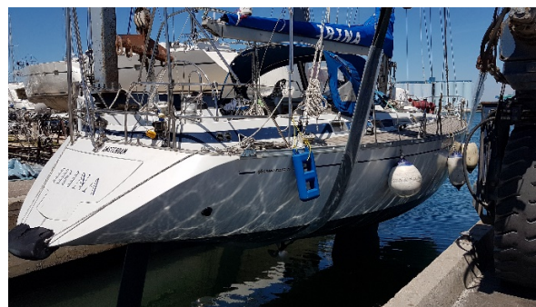
Tableau arrière basculant faisant plate-forme de bain

Eolienne, radar, panneaux solaires, hydro-générateur