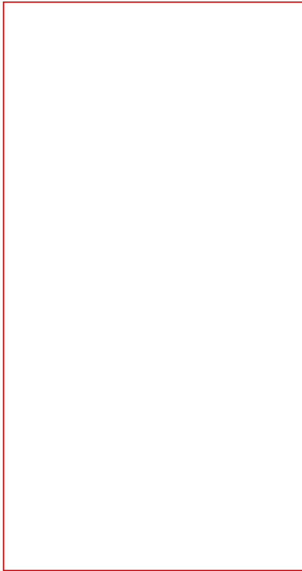
Figure 4 : Echos du transpondeur sur un écran radar

L'OMI recommande dans sa résolution A 802 (19) de placer l'antenne à au moins un mètre au-dessus du niveau de la mer. De plus le répondeur doit être étanche à l'eau à une profondeur de 10 mètres pendant au moins 5 minutes et de conserver son étanchéité après avoir subi un choc thermique de 450C. Les normes de fabrication sont également spécifiées.