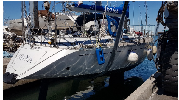
Tableau arrière basculant faisant plate-forme de bain

Eolienne, radar, panneaux solaires, hydro-générateur